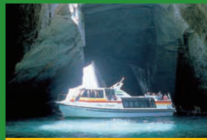
堂ヶ島マリン・洞窟めぐり