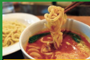
富士つけナポリタン