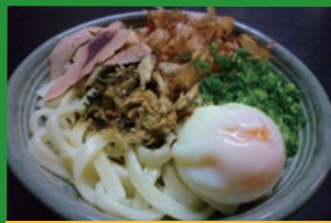
西伊豆しおかつうどん