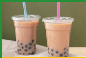
タピオカ伊豆牛乳ミルクティー