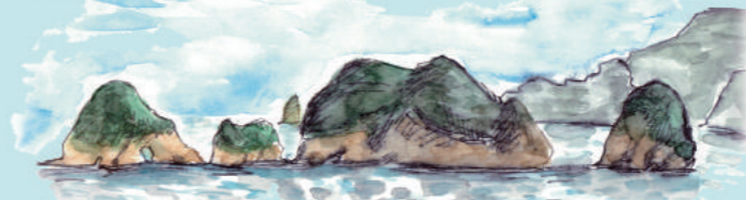
陸地側から「伝兵衛島・中ノ島・沖ノ瀬島・高島」4つの島で見えるポイントで3つの島や4つの島に見えることから三四郎島